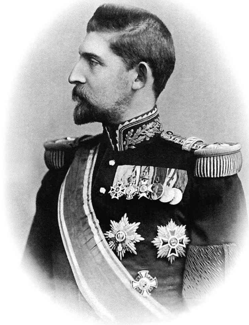
M.S. Regele FERDINAND I