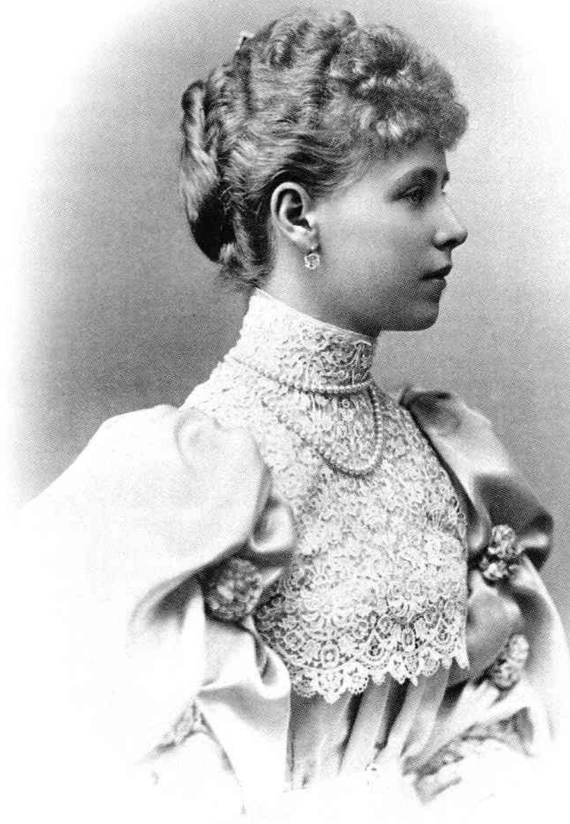
M.S. Regina MARIA